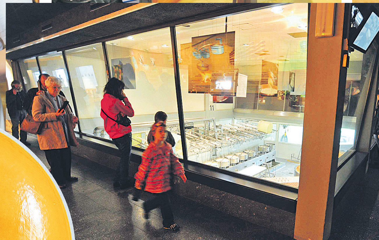
Besucher der Käseerei können durch große Glasscheiben die laufende Käseproduktion überblicken.