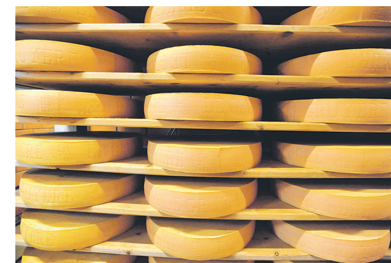
Vom Lager kommt der gereifte Käse zum Verbraucher – rund 30 000 Tonnen werden im Jahr produziert, die Hälfte davon bleibt in der Schweiz, rund 2 500 Tonnen werden in die Bundesrepublik Deutschland exportiert.

sten zehn Tage müssen die bis zu 40 Kilogramm schweren Laibe nämlich täglich, später ein bis zwei Mal pro Woche gewendet und mit Salzwasser gewaschen werden. Dadurch bleibt die Rinde und damit auch der Käse gesund.